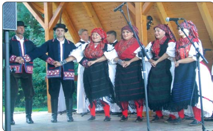
Plesači KUD-a Valpovo