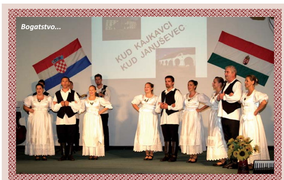
Člani KUD-a „Kajkavci“ na brdovečkoj pozornici

Pošto su potanko razgledali crkvu i njezin okoliš, svi zajedno uputili su se u jedan od zanimljivijih muzeja – Muzej krapinskih neandertalaca. Bili su oduševljeni postavom u Muzeju, a još više što je svaki od njih