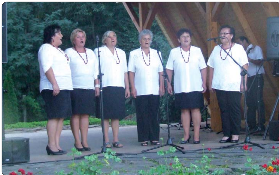
Martinački ženski pjevački zbor «Korjeni»