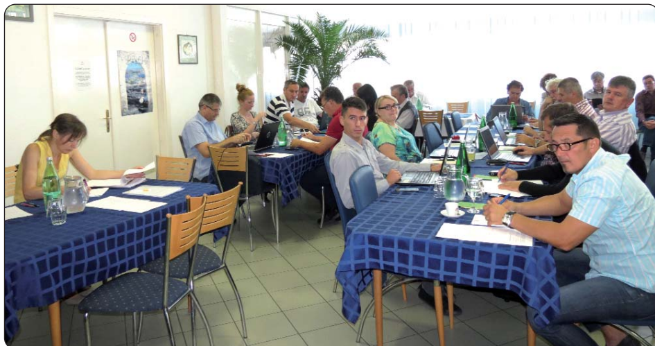
Sjednici se odazvalo 20 od 23 zastupnika HDS-ove Skupštine