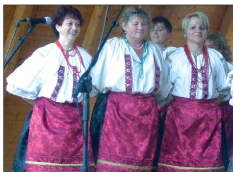
Hrvatski dan u Foku