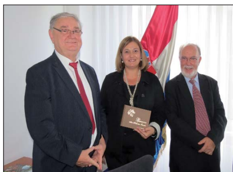
O Pjesmarici Ane Katarine Zrinske 8. stranica