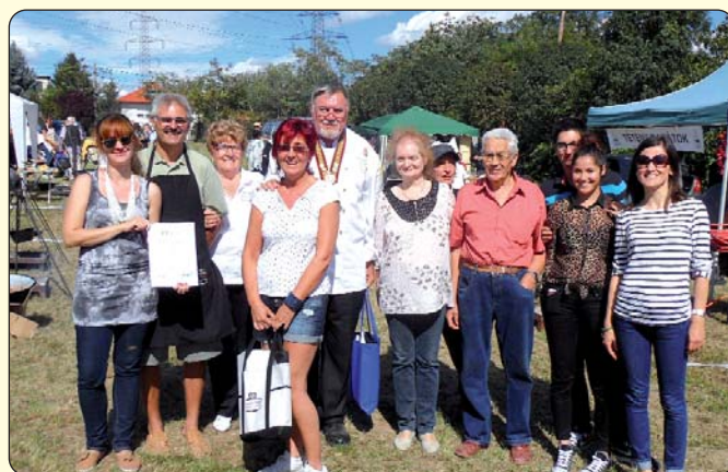
Sretna pobjednička družina

Tom se prigodom organiziraju i kulinarska natjecanja jer kako piti dobro vino bez ukusnih zalogaja! Ove je godine tridesetak natjecatelja predstavilo svoje kulinarske umijeće, među njima i družina Hrvatske samouprave toga okruga, koja svake godine sudjeluje na veselome natjecanju, i ubira „plodove“ truda odnosno postiže zavidne rezultate. Sada je međunarodno stručno povjerenstvo „specijalnoj kuhinji“ hrvatske družine dodijelilo prvu nagradu!