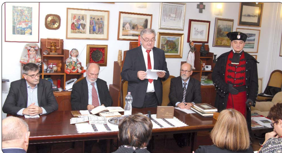
Književna tribina u Hrvatskome klubu Augusta Šenoe

U organizaciji Ogranka Matice hrvatske u Pečuhu, Znanstvenog zavoda Hrvata u Mađarskoj i Generalnog konzulata Republike Hrvatske u Pečuhu, 30. rujna u Pečuhu je na stručnom putovanju boravilo izaslanstvo Ogranka Matice hrvatske u Čakovcu, a istoga su dana Pečuh počastili i akademici Josip Bratulić i Stjepan Damjanović, potonji predsjednik Matice hrvatske.