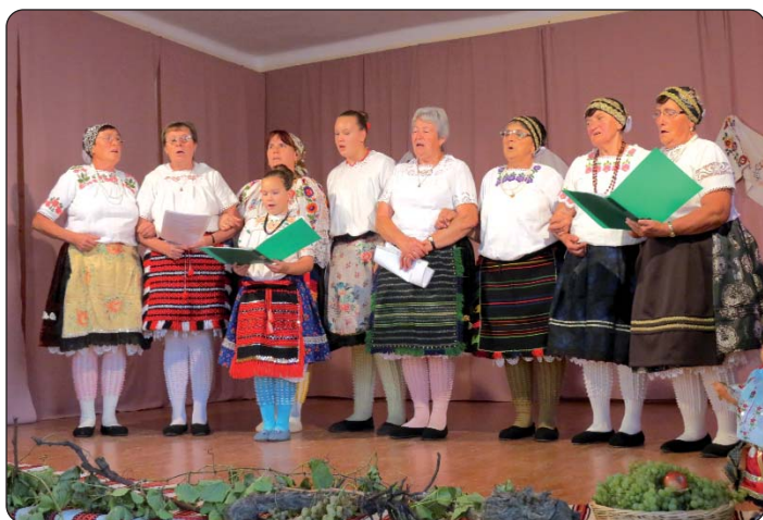
Vršendski Mješoviti pjevački zbor Orašje