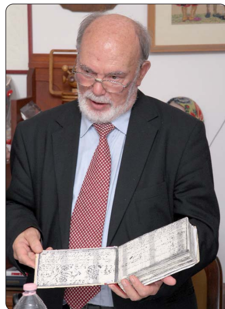
Knjigu je za tisak priredio akademik Josip Bratulić.

1991. godine darovao Nacionalnoj i sveučilišnoj knjižnici u Zagrebu. Pjesmarica Ane Katarine Zrinski govori o jednome burnom povijesnom vremenu, te obitelji Zrinskih i Frankopana čija je sudbina neraskidivo vezana za patnje i stradanja hrvatskoga naroda, ali i o unutarnjem doživljaju i intimi pjesnikinje Ane Katarine Zrinski, kazao je između ostaloga u svom