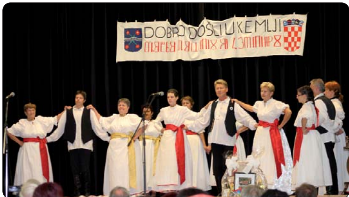
KUD „Konoplje“ dika je Kemlje

Prilikom 165. obljetnice rođenja Mate Meršića Miloradića, pjesnika, znanstvenika, velikana Gradišćanskih Hrvatov, i skoro 50 ljet dugo farnika u Kemlji, 19. septembra, u subotu, je Hrvatska samouprava dotičnoga sela pozvala najprlje u mjesnu crikvu na mašu zadušnicu, a za polaganjem vijenca pred Meršićevim spomenikom u šarenoj prošeciji su koracali brojni člani domaćih i gostujućih folklornih društava do Kulturnoga doma. Tamo je nastavljen program s pravim spektaklom i vridnom izložbom.