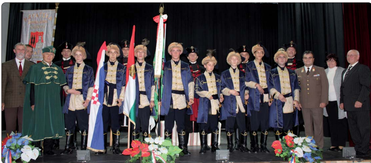
Članovi Zrinskih kadeta sa Zrinskom gardom