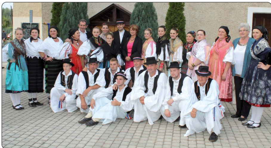
Domaćini s dragimi prijatelji iz Pleternice