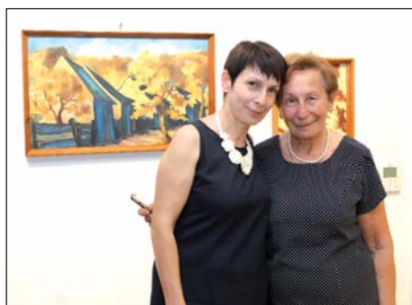
Brigovićeve izložba u Zagrebu