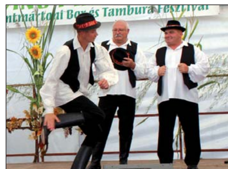
Zlevanka, vino i tambure