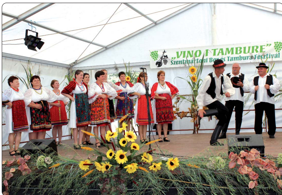
KUD Podravina predstavlja podravske plesove.