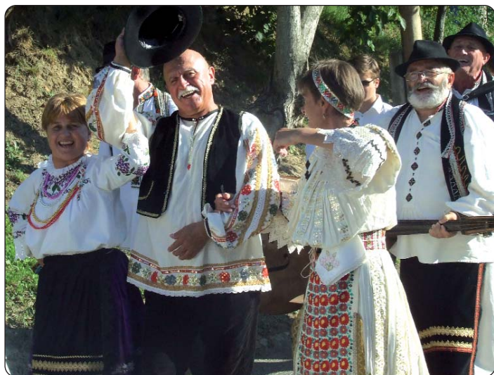
Kukinjska skupina u povorci kroza selo

Već uobičajeno okupljanje bošnjačkih Hrvata u Kukinju bilo je priređeno 21 put, ove godine 29. kolovoza. Organizator je Sijela bila kukinjska Hrvatska samouprava uz potporu tamošnje Seoske samouprave, Hrvatske samouprave Baranjske županije i Samouprave Baranjske županije.