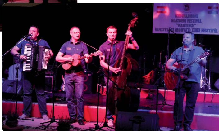
Veseli stroj iz Slatine