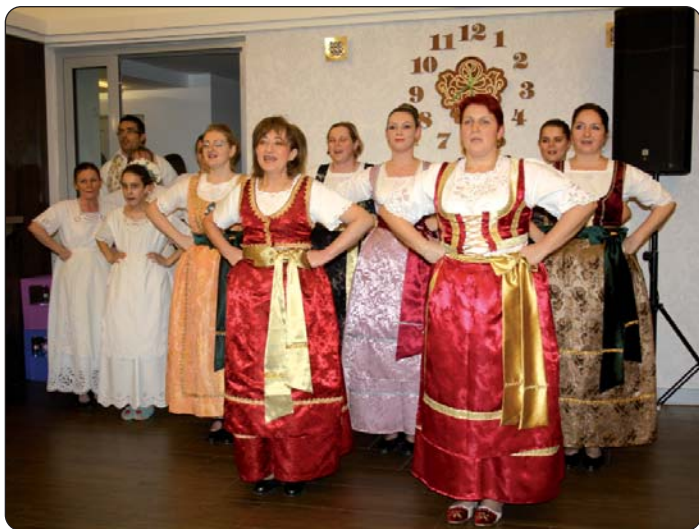
Na ovogodišnjem Bajskom prelu