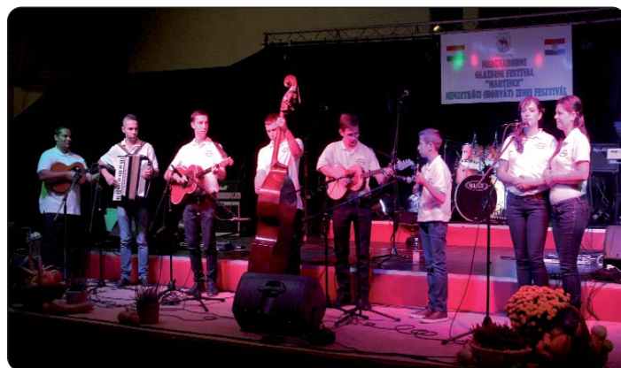
Tamburaški zbor i orkestar Biseri Drave