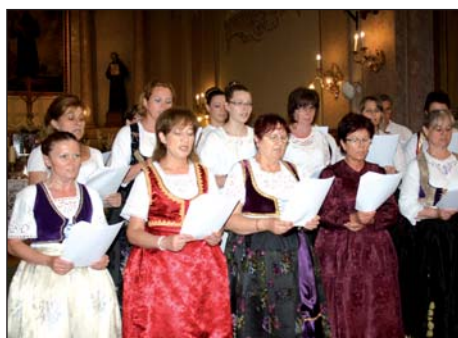
Bunjevačka zlatna grana