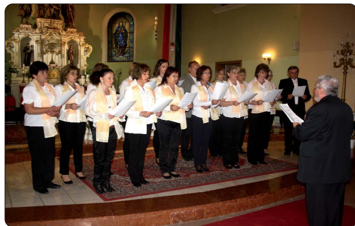
Prigodom posljednjeg nastupa u Aljmašu