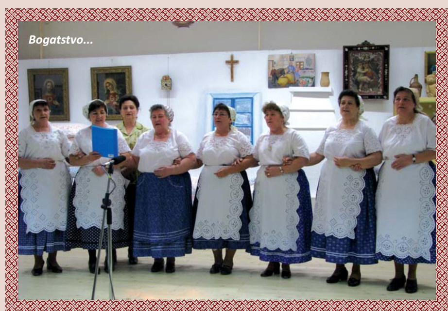
Dušočanke 2010. godine