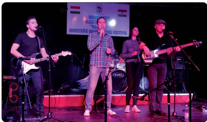
Virovitički sastav Imperia