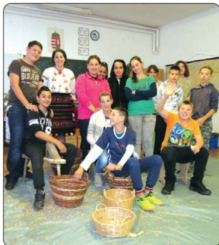
Oni su krunili kukuruz