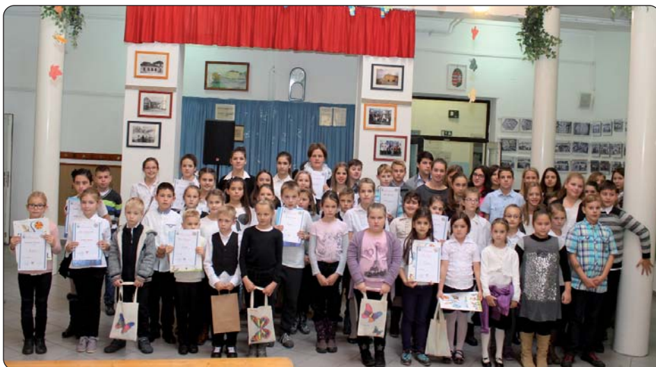
Svi diozimatelji jubilarnoga naticanja