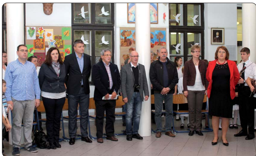
Časni gosti i člani žirija