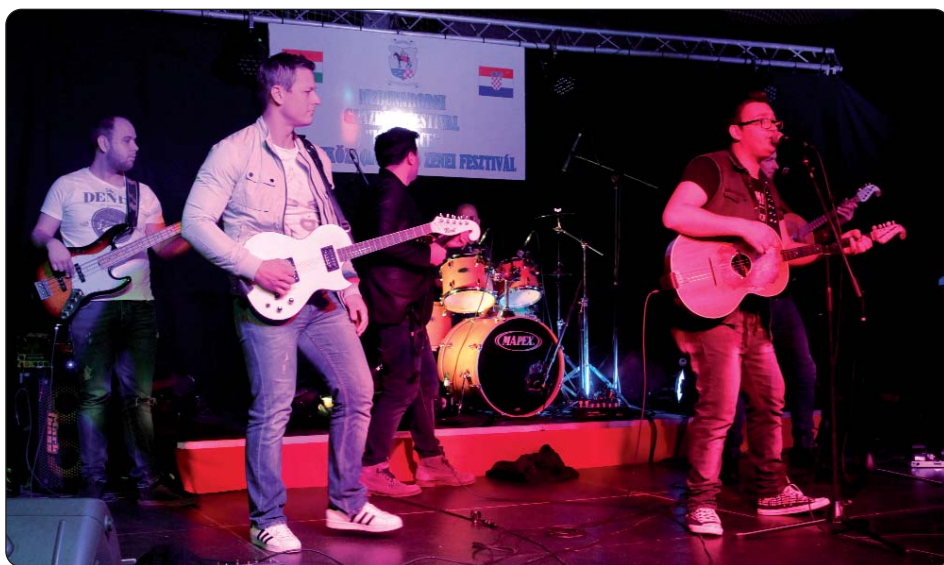
Tamburaški sastav Beginji