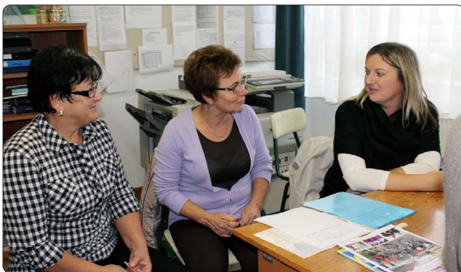
Do kraja godine Zavod će ostvariti sadržajne programe u suorganizaciji s raznim hrvatskim organizacijama i ustanovama.

Pošto je na zadnjoj skupštini Hrvatske državne samouprave prihvaćen program i proračun Hrvatskoga kulturno-prosvjetnog zavoda „Stipan Blažetin” za IV. tromjesečje tekuće godine, ustanova je započela svoj rad. Do kraja godine Zavod će ostvariti sadržajne programe u suorganizaciji s raznim hrvatskim organizacijama i ustanovama. Na HDS-ovoj skupštini održanoj 26. rujna 2015. godine u Kulturno-prosvjetnom centru i odmaralištu Hrvata u Mađarskoj u Vlačićima na otoku Pagu prihvaćen je proračun Hrvatskoga kulturno-prosvjetnog zavod „Stipan Blažetin” za 2015. godinu u iznosu od 7 263 000 Ft.