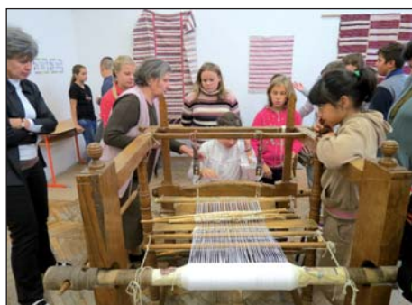
U salantskoj školi