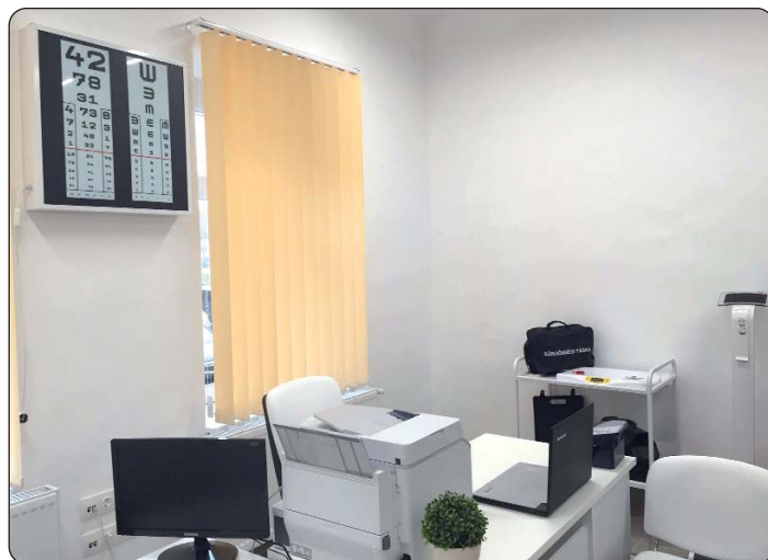
Moderna liječnička ordinacija