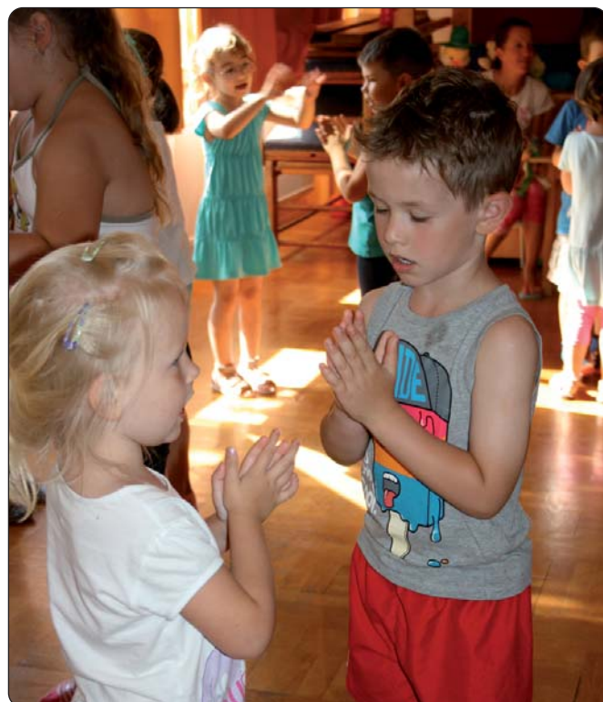
Učenje narodnoga plesa u dječjem vrtiću