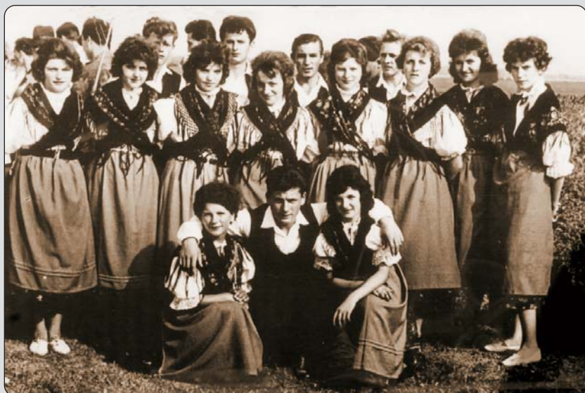
Pokojni su bili člani tancoške i jačkarne grupe u Petrovom Selu 1960-ih ljet