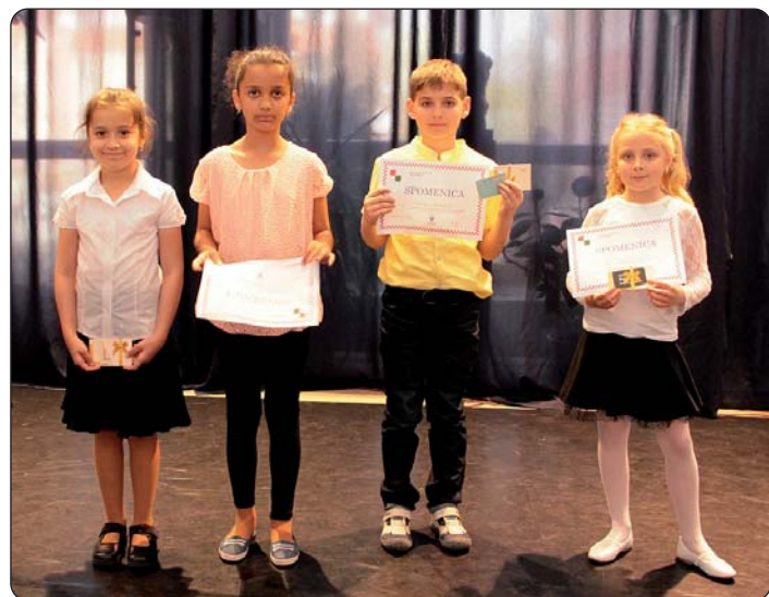
Dio najboljih u kategoriji niži razredi škola s predmetnom nastavom