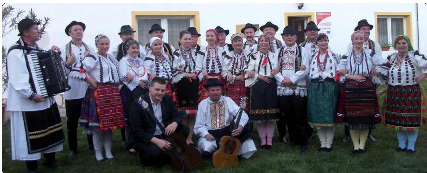
KUD Ladislava Matuška nastupio je na ovogodišnjem Narodnosnom danu.