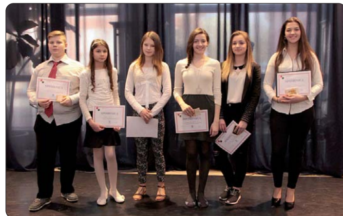
Najbolji u kategoriji viši razredi dvojezičnih škola