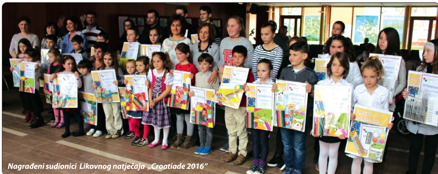
Nagrađeni sudionici Likovnog natječaja „Croatiade 2016“