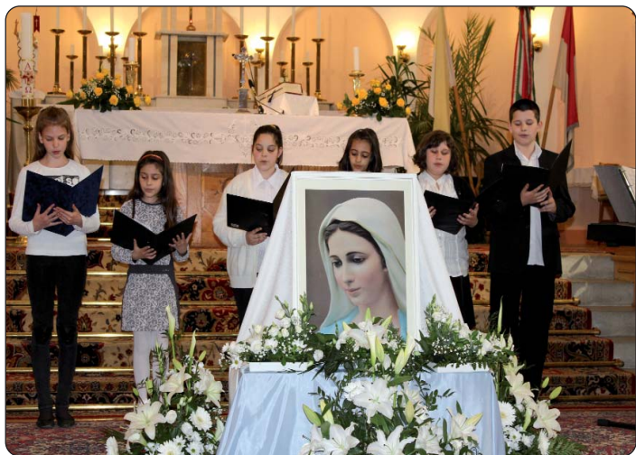
Keresturska djeca pjevaju „Zdravo, Marijo”

Hrvati su veliki štovatelji Blažene Djevice Marije, nije slučajno da je u pjesmi zovu „kraljicom Hrvata”. Brojne crkvene pjesme koje se i danas rado pjevaju vežu se uz nju. Još na poticaj pokojnog rektora varaždinske katedrale mons. Blaža Horvata ustrojen je prvi Susret „Pozdravljamo Mariju”, naime pomurski Hrvati imaju svoje marijansko svetište blizu Kaniže, u Komaru. Iz godine u godinu pomurski hrvatski zborovi pripremaju se na Susret, uče nove marijanske pjesme, a u zadnje vrijeme u slavlje se uključuju i mladi vjernici. Susret je započeo s hrvatskim misnim slavljem, prečasn Antun Hobljaj pozdravio je pomurske vjernike i prisjetio se mons. Blaža Horvata, koji je godinama pomagao pomurskoj hrvatskoj vjerskoj zajednici. Četvrte uskrсне nedjelje preč. Hobljaj u svojoj propovijedi usmjeravao je vjernike na to da je Isus položio svoj život za sve nas, i njegova ljubav znači isto za svakoga, na svim jezicima, i podjednako je jaka svugdje ma gdje bili. Neka njegovu ljubav vjernici uzvrate svojom ljubavlju u molitvi