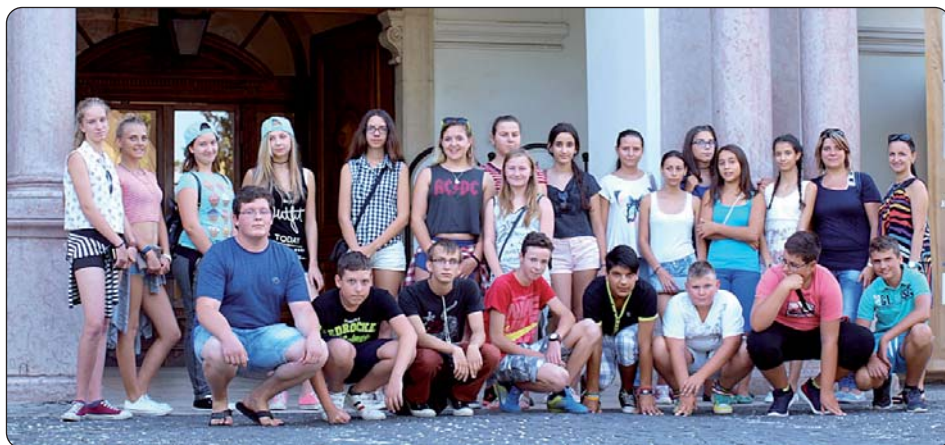
Kod Kraljevskoga dvorca u Godlovu