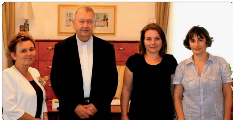
Predstavnici pomurske regije u društvu biskupa mons. Josipa Mrzljaka