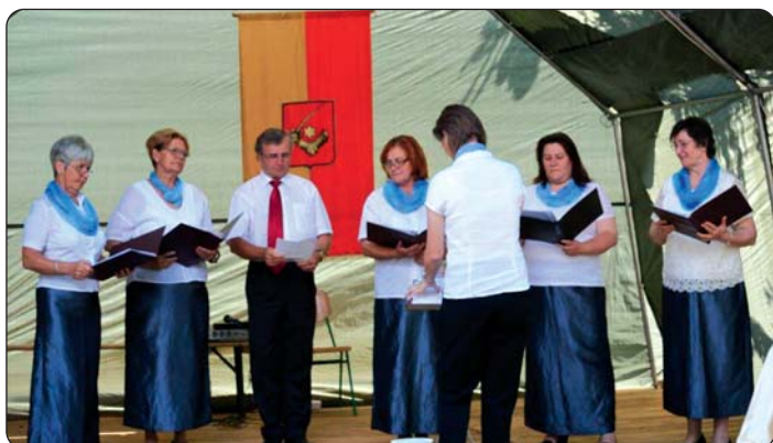
Jačkarni zbor „Sv. Cecilija“ na kulturnom programu