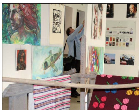
Treći Dan Santovaca