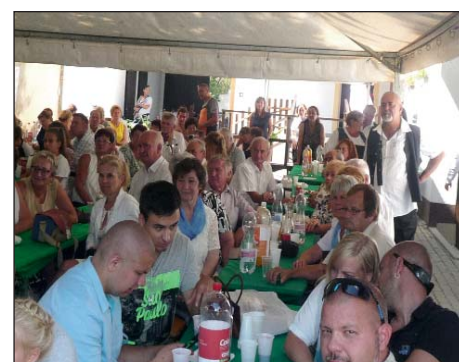
Svečanost u Plajgoru