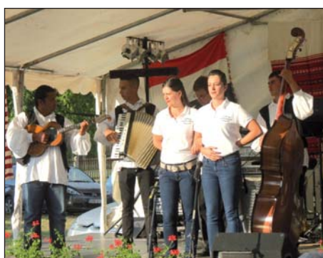
Hrvatski ljetni festival u Potonji