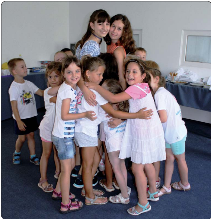
Igra s dobrovoljcima

U hrvatski dječji kamp prijavilo se tridesetero djece iz Serdahela, Pustare, Letinje, Kaniže i Budimpešte, čiji su roditelji rodnom iz pomurskih mjesta.