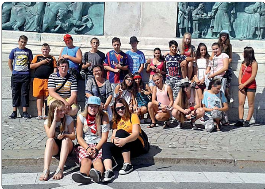
Na Trgu junaka