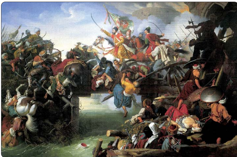
Johann Peter Kraff: Proboj Zrinskog iz Sigeta

Matica hrvatska i Društvo hrvatskih književnika pripremaju nekoliko izdavačkih projekata – knjigu hrvatskih epskih i lirskih knji-