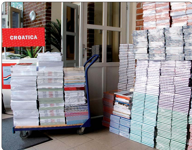
Redaju se udžbenici.

dotatno osamdeset naslova na Croaticinu popisu udžbenika. Proširit će se i broj narodnosnih novina koje se tiskaju u našoj izdavačkoj kući, naime u tijeku su pregovori s ukrajinskom, poljskom i rusinskom manjinom. U lijepom se broju naručuje Hrvatsko-mađarski rječnik, što se za druge naslove i ne može reći, naime ona slabo se kupuju.