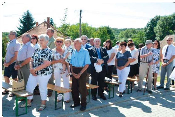
Dio vjernikov na crikvenom obredu

hrvatskom kulturnom programu nastupili su jačkarni zbor „Sv. Cecilija“ iz Sambotela, mišoviti pjevački zbor „Zviranjak“ iz Prisike, jačkarice „Peruške Marije“ iz Hrvatskoga Židana i HKD „Čakavci“ s tamburaši iz Hrvatskoga Židana.