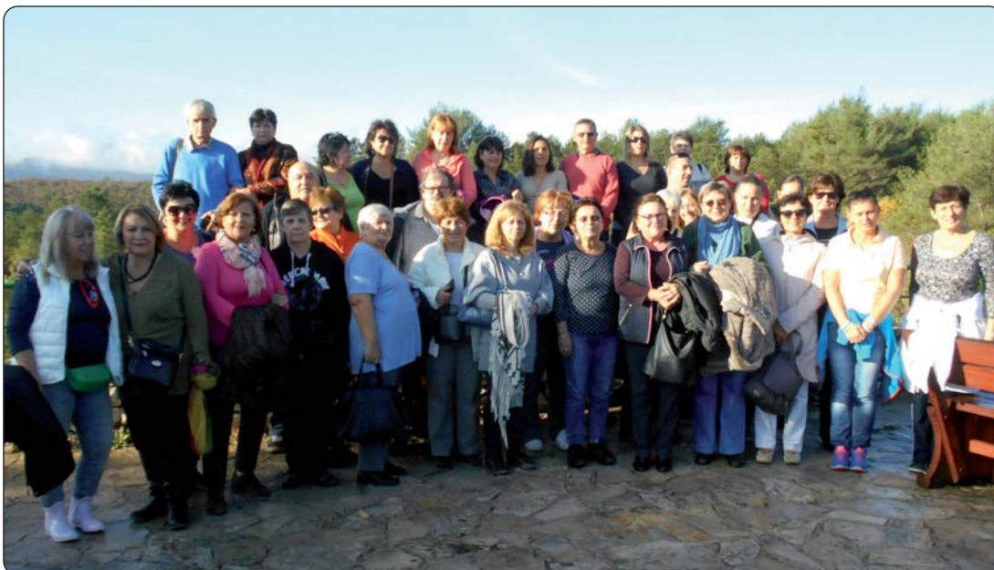
Četrdesetak vjernika iz Budimpešte na putu prema Kraljici Mira