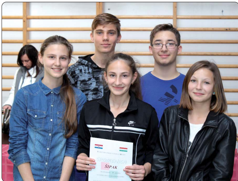
Družina Šipak osvojila je prvo mjesto.