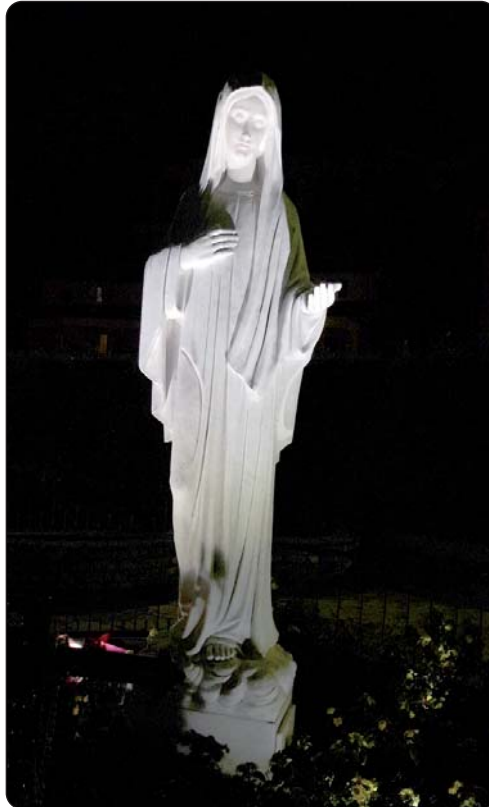
Gospa u međugorske svetištu