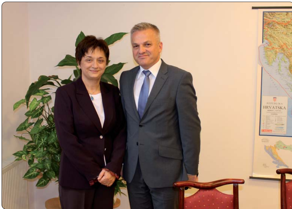
Predstojnik Središnjega državnog ureda za Hrvate izvan Republike Hrvatske s vašom urednicom

Povod je Vašega današnjeg dolaska u Pečuh XIII. Međunarodni kroatistički znanstveni skup u organizaciji Znanstvenog zavoda Hrvata u Mađarskoj. Zašto ste smatrali važnim da Središnji državni ured za Hrvate izvan Republike Hrvatske, čiji ste Vi predstojnik, bude pokrovitelj Skupa?