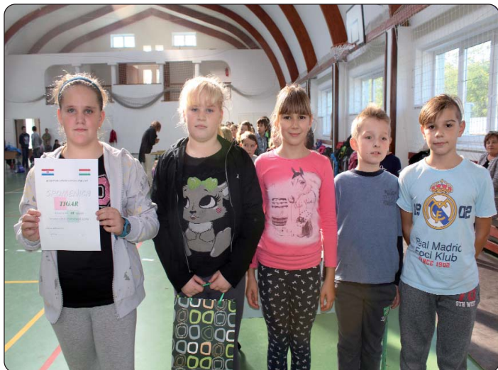
Družina Tigar osvojila je treće mjesto.

Na već tradicionalnome županijskom susretu bačkih učenika okupilo se umalo 130 učenika iz osam bačkih osnovnih škola predmetne odnosno dvojezične nastave hrvatskoga jezika i desetak pratećih učitelja i nastavnika. Susret je ostvaren sa supotpomom HDS-a, Županijske hrvatske samouprave i pakšanske Nuklearne elektrane.