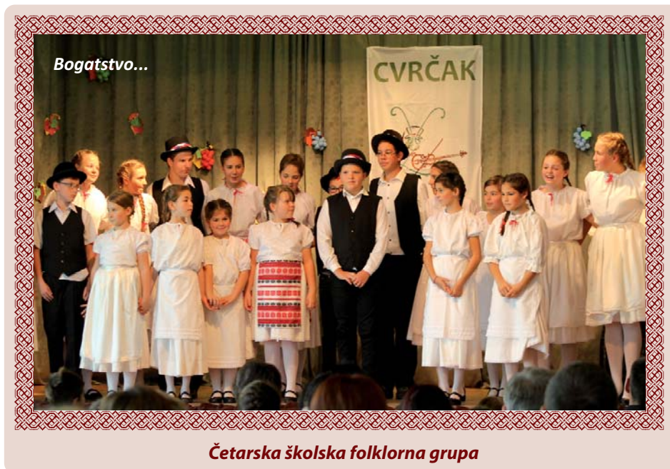
Četarska školska folklorna grupa