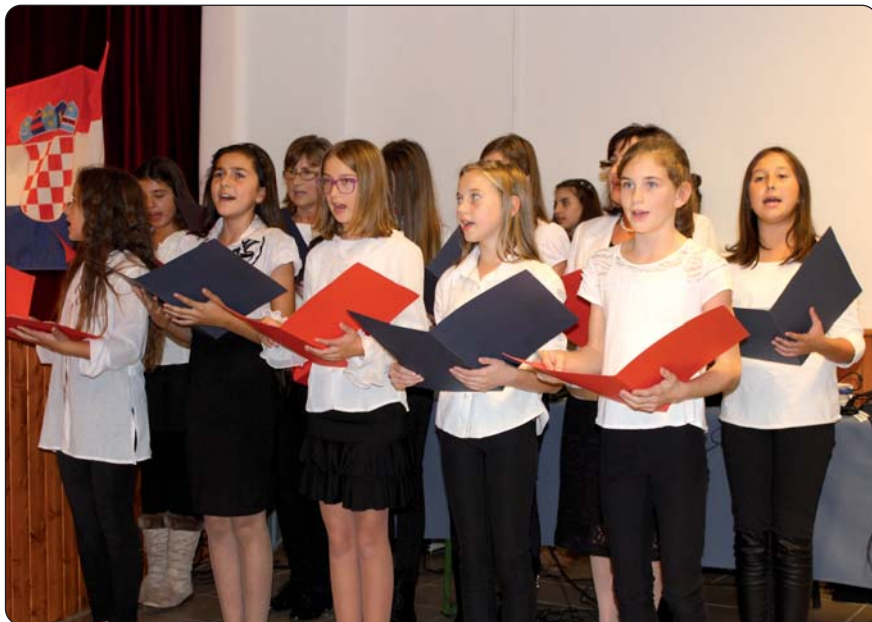
Pjevački zbor serdahelske škole