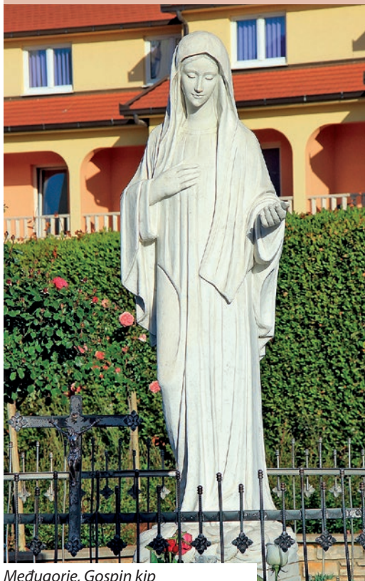
Međugorje, Gospin kip

„Zdravo Marijo“, najpoznatija molitva kojom se Crkva stoljećima obraća Blaženoj Djevici Mariji konačan oblik poprimila je 1346.-1353. godine, kada je Europom zavladała najsmrtonosnija epidemija kuge.