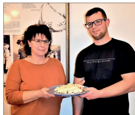
Kad ti je posao ujedno i hobi