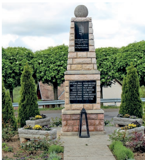
Uređen je i centar naselja sa spomenikom žrtvama svjetskih ratova

ljepšem kukinjskom vrtu: vrtlari imaju puno posla, ovogodišnje hirovito svibanjsko vrijeme nije im baš pogodovalo. Mnogi su iz „škrinja“ izvukli nagomilano znanje, a neki su ga i unaprijedili svojim metodama obrade tla i uzgoja biljaka, kako bi proizveli pravo domaće mirisno povrće za obiteljski stol. Djecu su pri tome naučili koliko je koristan i lijep rad u svom vrtu, ili „bašči“, kako ga kukinjski Hrvati nazivaju, jer bez „bašče“ nema pravoga života. Takvu filozofiju slijede i mladi kukinjski vrtlari, od kojih neki sudjeluju i u natjecanju za izbor najljepšeg vrta. Hoće li pri tome odnijeti pobjedu i nije toliko važno. Važno je imati vrt, ako ništa drugo onda i onaj minijturni, na svom balkonu.