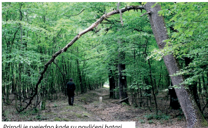
Prirodi je svejedno kade su povlićeni hatari