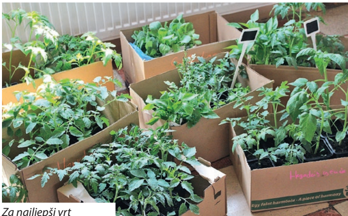
Za najljepši vrt

pozvano na sudjelovanje u svim kategorijama, od balkonskog, preko minijaturnog do velikog vrta, čemu se odazvalo 14 kućanstava, koja su dobila sjeme i sadnice. Njegovanje i praćenje razvoja bilja sad predstavlja njihovu zadaću. Kako je rekla Dóra, koja se i sama sa suprugom prihvatila rada u vrtu, prate se sve faze rasta do ubiranja plodova, a na kraju vrtovi će se ocijeniti prema projektnim uputama.