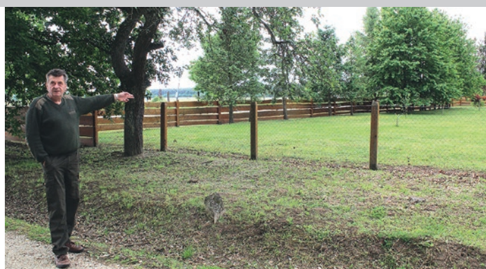
Vilmoš Dezső nad prvim trianonskim kamenom pokaže dvor na Erdőházi, koji bi bio po diktatu raspolovljen na austrijski i ugarski dio