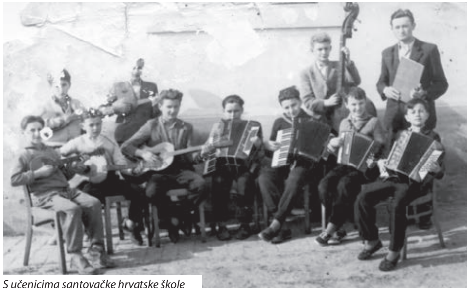
S učenicima santovačke hrvatske škole

radim iz ljubavi! „Kako je rekao, za svog kantorskog mandata služio je osam župnika i šesnaest kapelana. Na posljednji put ispratilo ga je oko 2200 sumješšana.