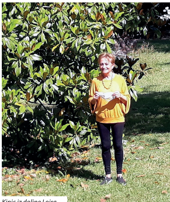
Kipic iz doline Loira