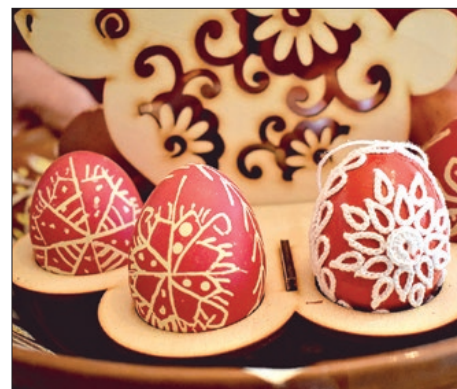
Spoj tradicije i modernog