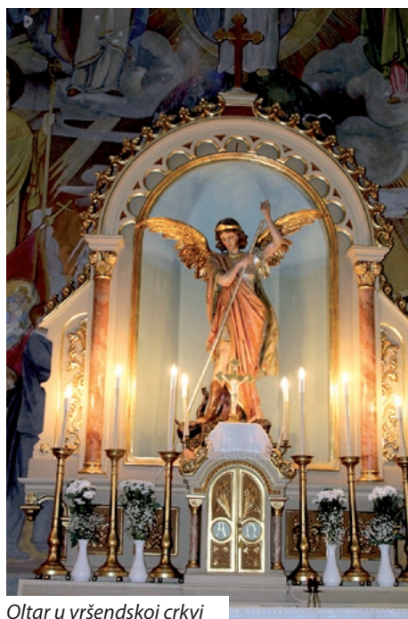
Oltar u vršendskoj crkvi

godinu dana zapošljavali su pet osoba preko vladinog programa kojeg trenutno nema, ali se nadaju kako će se otvoriti nove mogućnosti koje – ako ih bude – namjeravaju iskoristiti. Godišnji proračun je 2020. godine bio oko 3,2 milijuna forinti. Usko surađuju s Kulturnom i vjerskom udrugom šokačkih Hrvata koja je za djelovanje u 2021. godini dobila državnu potporu od 2 000 000 ft. Planova ima, ali