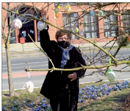
Barčanski uskrsni ugođaj