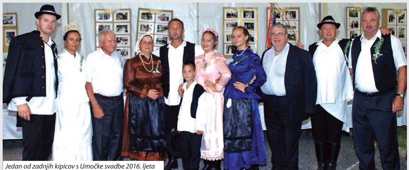
Jedan od zadnjih kipicov s Umočke svadbe 2016. ljeta