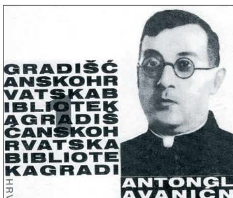
75. obljetnica smrti Ivana Blaževića 8. – 9. stranica