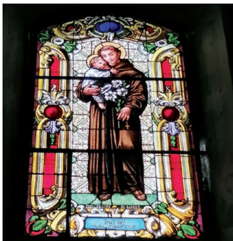
Na jednom od obnovljenih vitraja vraćena su imena nekadašnjih darovatelja: „Dali su praviti Benco, Dico, Pavka Zomborcsevits“

Kako dodaje Edmond Bende, u posljednjih stotinjak godina (od 1909.), osim obnove krova i vanjskih zidova nije bilo značajnijih radova na obnovi župne crkve.