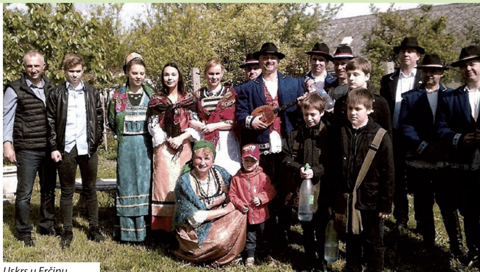
Uskrs u Erčinu

U vrijeme korizme velik dio erčinskih stanovnika je postio, pri čemu je petak bio dan strogog posta i nemrsa. Uoči Velikog tjedna djeca su u okolici grada skupljala grančice ukrasne vrbe, cicamace, koje bi se na Cvjetnicu nosile u crkvu na blagoslov. Nakon toga nosile su se kućama, a nekoliko grančica stavljalo se na tavan kako bi se kuća zaštitila od groma i požara, ali nosile su se i pokojnicima na groblje. Taj običaj u Erčinu je prisutan i danas. U ponedjeljak i utorak čistila se kuća, dvorište i štale, osobito one ispred kojih je prolazila procesija križnog puta. U srijedu se čistila crkva i izrađivao Isusov grob. Na Veliki četvrtak ujutro