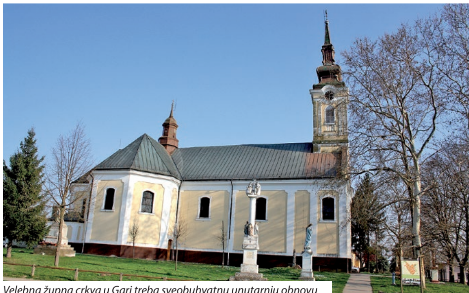
Velebna župna crkva u Gari treba sveobuhvatnu unutarnju obnovu

Dodajmo kako se donacije primaju u gotovini ili se mogu doznati na bankovni račun Župnog ureda, Takarékbank, broj računa: 51000132-14007419-00000000, s naznakom „Za obnovu garske crkve“. Obnova se može podržati i dodjelom jednog postotka poreza na dohodak „Zakladi za očuvanje garske graditeljske baštine“, najkasnije do 20. svibnja 2021. godine, porezni broj Zaklade: 18035526-1-03. S.B.