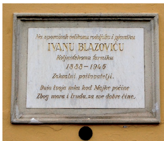
Spomen-ploča na stijeni koljnofske Hodočasne crikve

osobito odlikuje kao duhovnika i narodnjaka, to je njegovo pisateljsko stvaranje” mislio je za njega Ignac Horvat, 1971. ljeta. Mnogobrojna književna djela su objavljena u Naši Novina, u Kalendaru sv. Familije, Hrvatski novina, u Katoličanskom Ljudskom Savezu, u Mali Crikveni i Školski novina, u Kalendaru sv. Mihovila itd. U njegovu vrime najčitanija je pjesma-legenda „Koljnovska Maria. Čudno pripetenje hodočasne kapele“. Nabožnu epsku pjesmu na 12 stranic, u jurskom izdanju Naših novina iz 1920. ljeta, nisam prlje ni znala, ali sam našla i u vlašćoj knjižnici doma. Hvala Bogu Hrvatsko štamparsko društvo u Austriji je u seriji Gradišćanskohrvatska biblioteka 1996. ljeta najprlje objavila njegovu Prozu, potom pak i Tugomirove (pjesnički pseudonim) Izabrane pjesme, po izboru dr. Nikole