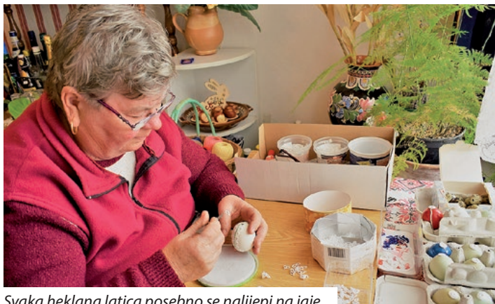
Svaka heklana latica posebno se nalijepi na jaje

„Da sam bila deključka pisanice smo pisale kičicom pak vojskom. Narajzali smo se kaj je došlo na pretuletje, muceke, ružice, tulipane, a farbu je mama skuhalo od černoga luka. Lepo mi je bilo i to delate sam kaj te pisanice nesu tak dogo mogle stati. Jemput je meni sosedo donesla pisanicu takvu kakvu ve delam, gledala sam kak se to dela, al onda nesem se hapila to delati. Da mi je muž fmrl onda nekak me je smirivalo takvo delo – ručni rad. Našla sam iglu za klekanje, pak sam se hapila to probate. Jajceke