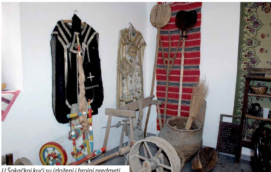
U Šokačkoj kući su izloženi i brojni predmeti

što će se ostvariti uveliko ovisi o epidemiološkim mjerama i pandemiji koronavirusa. Radi se i na drugom dijelu knjige „Lipa naša Vršenda“, skupljaju se priče, anegdote, dječje brojalice iz starih vremena. I Hr-