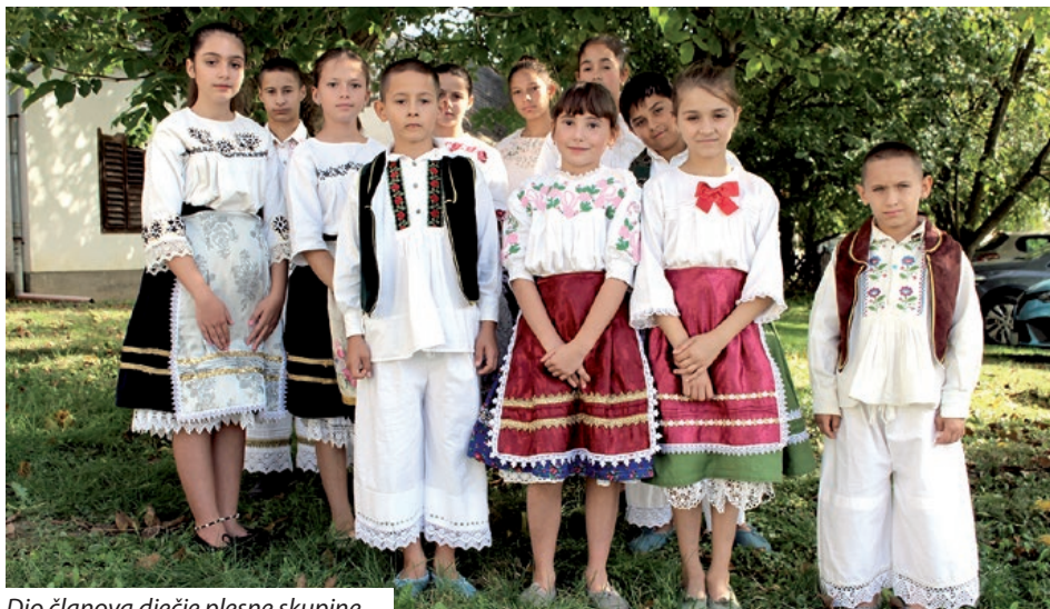
Dio članova dječje plesne skupine