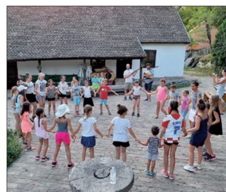
Hrvatski folklorni kamp „Pačići”