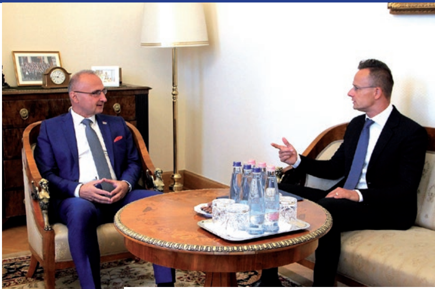
Susret ministara Pétera Szijjártóa i Gordana Grlića Radmana

„Odnosi naših dviju zemalja temelje se na dugotrajnim vezama koje imaju za rezultat uspješnu suradnju u brojnim područjima od zajedničkog interesa“, rekao je ministar Gordan Grlić Radman, zahvalivši se Mađarskoj za donaciju Sisačko-moslavačkoj županiji nakon potresa i mogućnosti ljetovanja preko 400 djece s potresom pogođenih područja na jezeru Velencei. Naglasio je da je Mađarska prepoznala Hrvatsku kao sigurnu destinaciju za godišnji odmor, o čemu najbolje svjedoče brojke. Naime, u prvih sedam mjeseci ove godine Hrvatsku je posjetilo više mađarskih