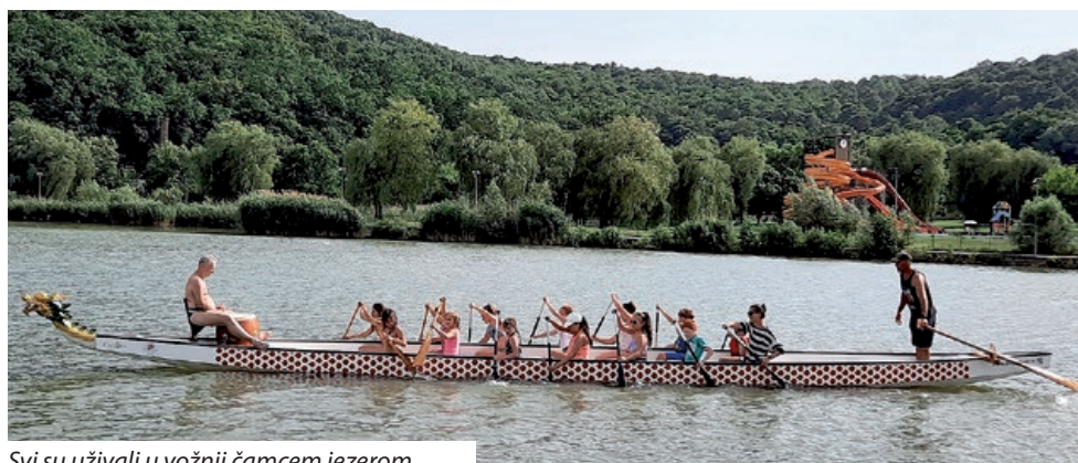
Svi su uživali u vožnji čamcem jezerom