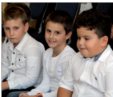
Otvoreno peto školsko ljeto